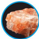
Kalium carbonicum D4