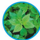
Urtica urens D3