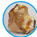
Amбра grisea D4

Qəbul qaydası: 10-15 damcı gündə 3 dəfə yeməkdən 30 dəq əvvəl və ya 1 saat sonra.