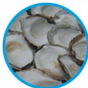
Calcium carbonicum Hahnemanni D8