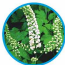
Cimicifuga racemosa D4