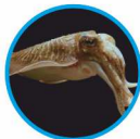
Sepia officinalis D8