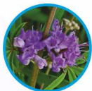
Vitex agnus-castus D3